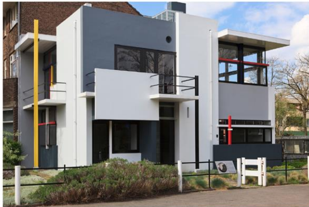
stambeni objekt arhitekta Gerrita Rietvelda

Koje geometrijske likove i tijela uočavaš na kućama?