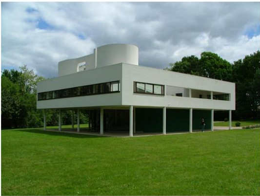
Vil a Savoye, arhitekt Le Corbusier

Promotri fotografije stambenih objekata.