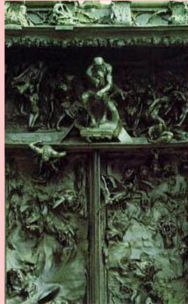
August Roden: Vrata pakla, detalj

Neki dijelovi reljefa jako izlaze u prostor. Lik mislioca npr., negdje se posve oslobađa podloge.