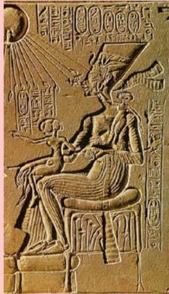
Amenhotep IV s Nefretete, 1360.g.p.n.e.

Likovi su uleknuti, prostor ulazi u masu. Ništa nije ispupčeno. Svi likovi su u negativu.