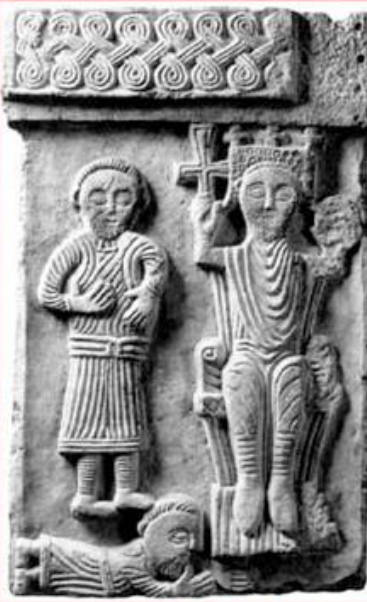
Kralj Zvonimir (?), Split, Solin, 11st.

Masa malo izlazi u prostor, svi likovi su ispupčeni, noge i ornament su na dvostrukoj visini.